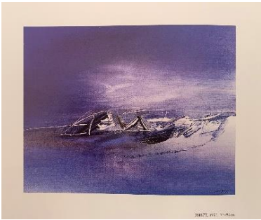
Sans titre, 1993, Acrylique sur toile, 73 x 92 cm