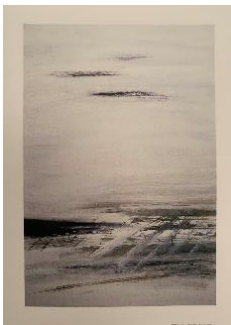
Sans titre, 1989, Acrylique sur toile, 130 x 97 cm

Après en avoir délibéré et à l'unanimité, le Conseil Municipal accepte le don d'œuvres.